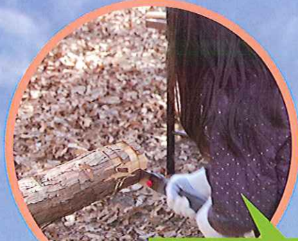
丸太切り 丸太を水平に切れば合格。 コースターを作成