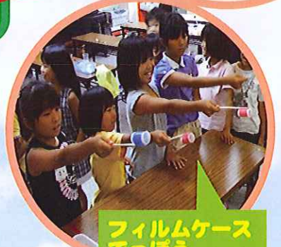
フィルムケース でっぼう フィルムケースのふたを飛 ばした距離が3mで合格