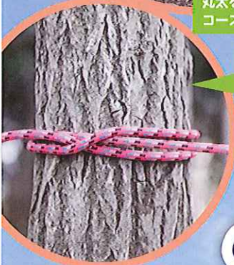
巻き結び ペットボトルを巻き結びで 止めてほどこなければ合格