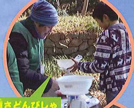
重さどんびしゃ 石・砂や野菜・果物で重 さを当てて誤差10%で あれば合格