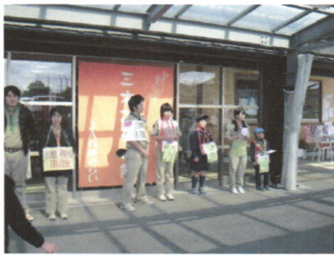
J A兵庫 みらい