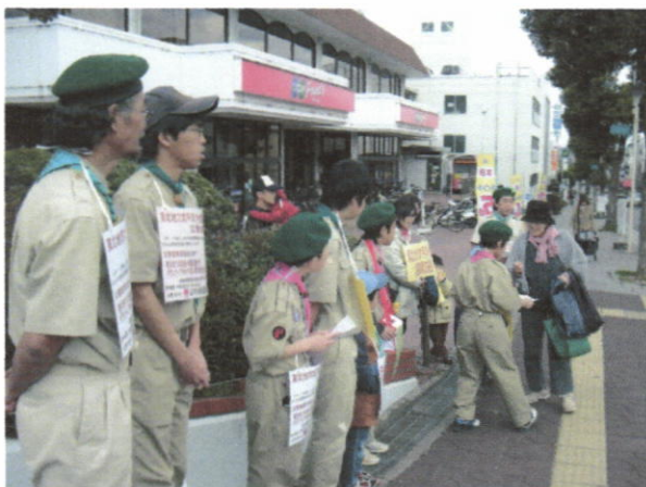
コープ 三木志染店