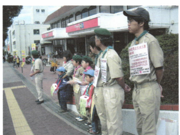
コープ 三木志染店