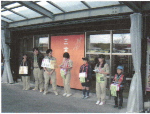
J A兵庫 みらい