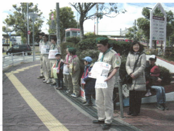
コープ 三木志染店