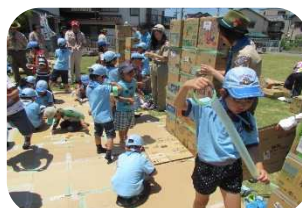
BVS：ダンボールを使った秘密基地作り