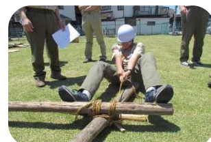
VS：パイオニアリング