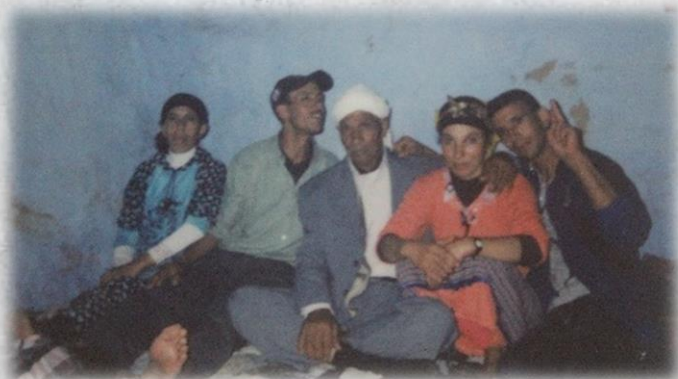
▲アトラス山脈にて 初めての家族写真に興奮するアマジグ人の家族