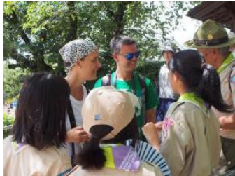
姫路城でおもてなし