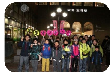
BS全山縦走（ゴールの宝塚）