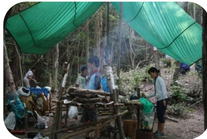
BS隊夏期野営（木の設営）