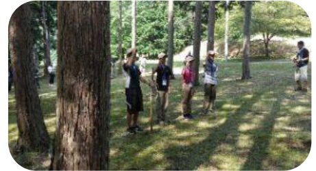
ボーイ隊活動写真