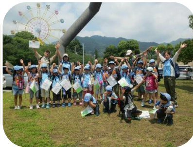
ビーバー隊活動写真