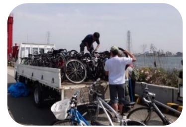
団委員さんの技能草級の技！