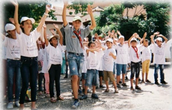
▲シャフシャウエンにて モロッコのスカウトたち