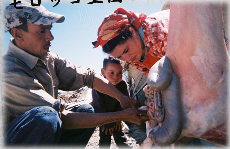
▲アトラス山脈にて 犠牲祭のため羊を暮るアマジグの家族