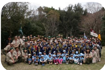
45周年記念イベント