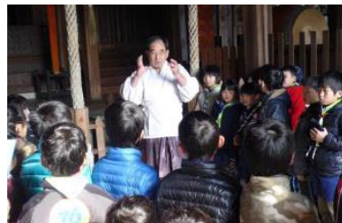
宮司さんのお話し