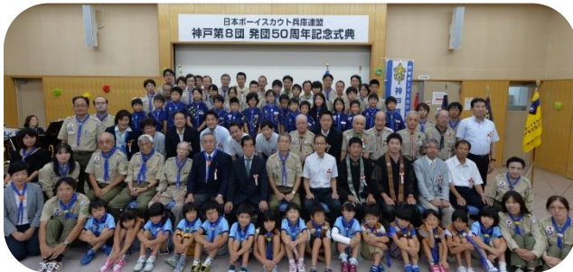
発団50周年記念式典