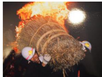
原の火祭りに参加