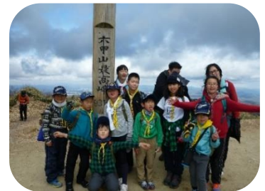
CS分断縦走（六甲最高峰）

こんなBVSからRSまでの一貫教育を理解してくださる保護者の方々と、活動をいつも支えてくれる団委員さんが私たちの誇りです。