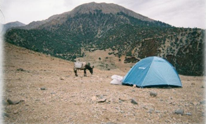
▲アトラス山脈トレッキング 購入したドンキーとテント