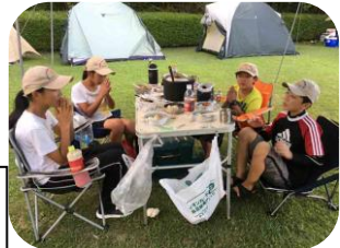
BS夏キャンプ (ウサギ班の夕食)