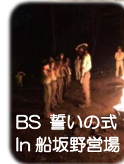
BS 誓いの式 in 船坂野営場