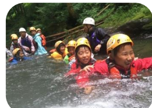
CS夏キャンプ (シャワークライミング)