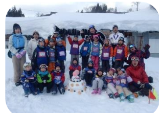
BVSスキー訓練 (鉢伏大久保ゲレンデ)