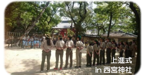
上進式 in 西宮神社

私たちは西宮神社（えびす神社）の界隈を中心に、北は甲山から南は西宮ヨットハーバーまで、広い育成区域で活動をしています。イギリスからボーイスカウト運動が紹介されて数年後の1924年（大正13年）に「西宮義勇少年団」として発足し、1959年に西宮第10団となり、戦時中などは山あり谷ありではありましたが、90年を超えて活動を続けてきました。現在、スカウト数ビーバー隊10名、カブ隊5組31名、ボーイ隊2班13名、ベンチャー隊13名、ローバー隊10名で、団まつり、スキー舎営、六甲縦走、7泊長期野営、地域の夏まつり、清掃活動など、海から山まで恵まれた地域の自然特性を活かし活動を行っています。