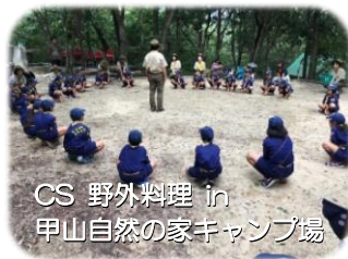
CS 野外料理 in 甲山自然の家キャンプ場

「スカウトの基本がしっかり実践出来ており、楽しく活動できていれば、スカウト数は自然に増加する」と信じて活動してきたところ、現在はスカウト数が上向き調子で増加しています。あとは、それを長期間にわたり維持するために、より多くの成人に参加と理解を深めてもらい、自発的な活動を継続しているところです。