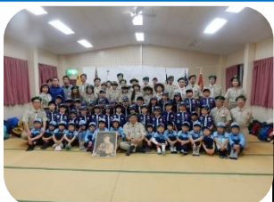
団スキー舎営様子 (B-P祭後の集合写真)