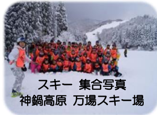
スキー 集合写真 神鍋高原 万場スキー場

今後は、2024年の創立100年に向けて心身共に健全な少年・少女の育成に努め、地域社会や国際社会に役立つ人材を輩出し続けたいと思っています。