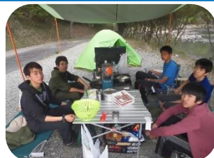
VSキャンプ活動 (夕食準備様子)