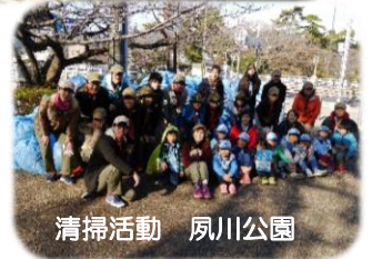
清掃活動 夙川公園