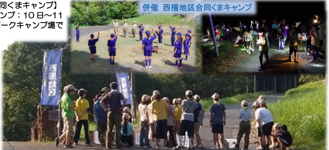
併催 西播地区合同くまキャンプ

来年のHyocamに向けて地区としてもこれを機に盛り上がっていただければいいと思います。