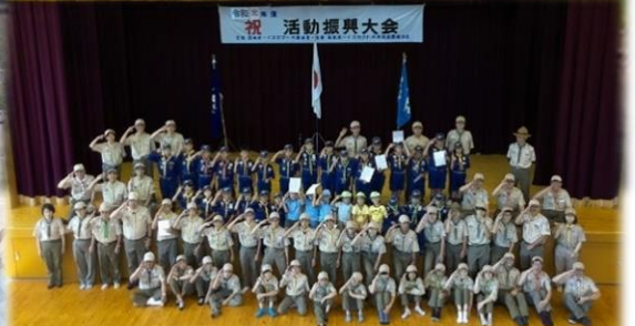
併催 西播地区活動振興大会