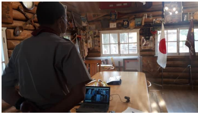
Skype 隊集会開会セレモニー