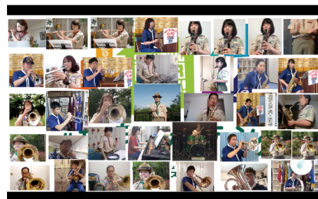
リモート合奏「能登のチカラ未来へ」の様子

先述の音楽隊の団の保護者から、「活動が停滞している中で楽器を持つ機会と目標をもたせてもらえてありがたかったです」というお声をいただきました。参加者からも「軒並み演奏会が無くなっていく中で演奏の機会をもらえてありがたかった」という連絡もいただきました。