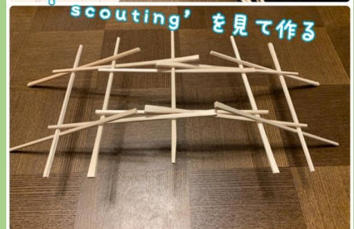
レオナルドの橋、名前もカッコいい！