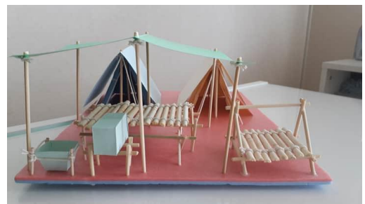
野営技能、班サイトを作ろう！